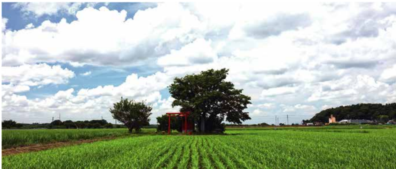
こころの風景 水挽副院長コレクション