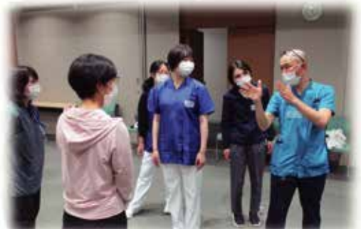
CVPPP インストラクターの指導を受けながら写真手前の当事者役に与える印象を比較する様子