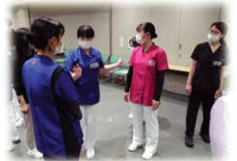
パーソナルスペースを確認する様子

当事者に向き合うフォーメーションによって当事者に与える印象の違いを下の写真からお感じ頂けるでしょうか？写真左下は圧迫感やさらに当事者に不安を与えるかもしれませんね。